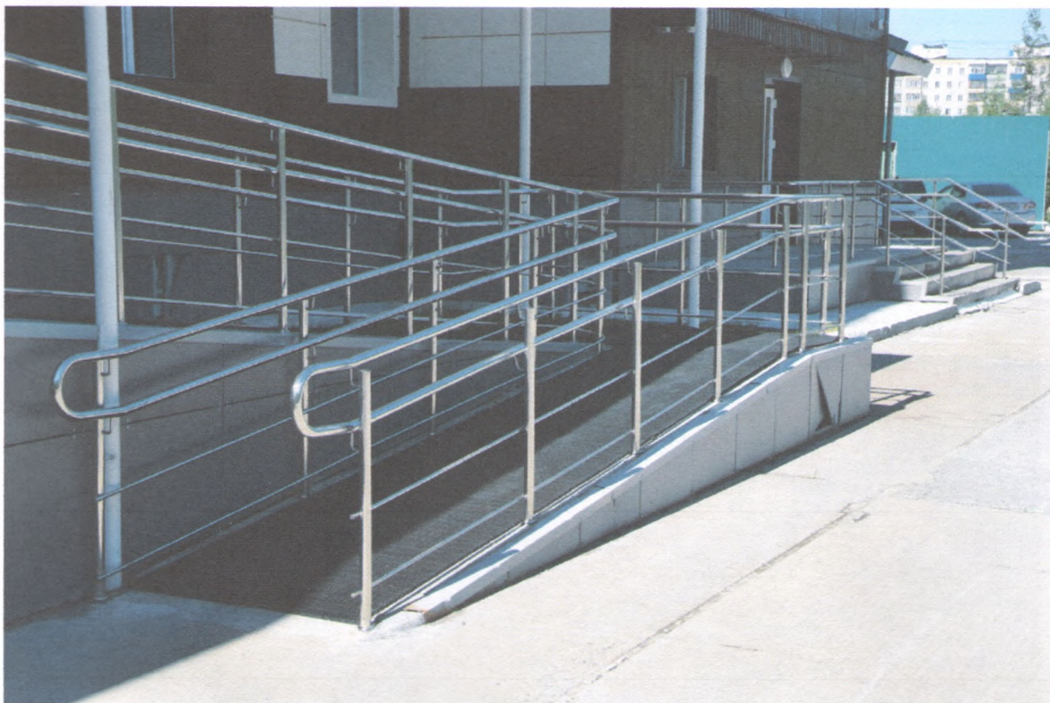
ПАНДУС НАРУДНЫЙ 1/9