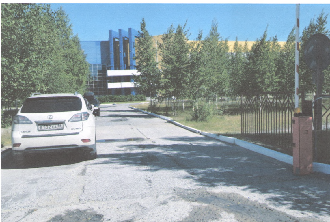
ВХОД НА ТЕРРИТОРИЮ 1/2