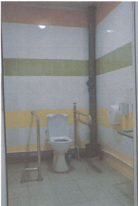
КАБИНКА ТУАЛЕТА 5/3