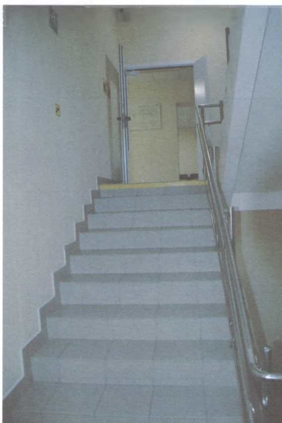
ДВЕРЬ НА ВТОРОЙ ЭТАЖ 2/7