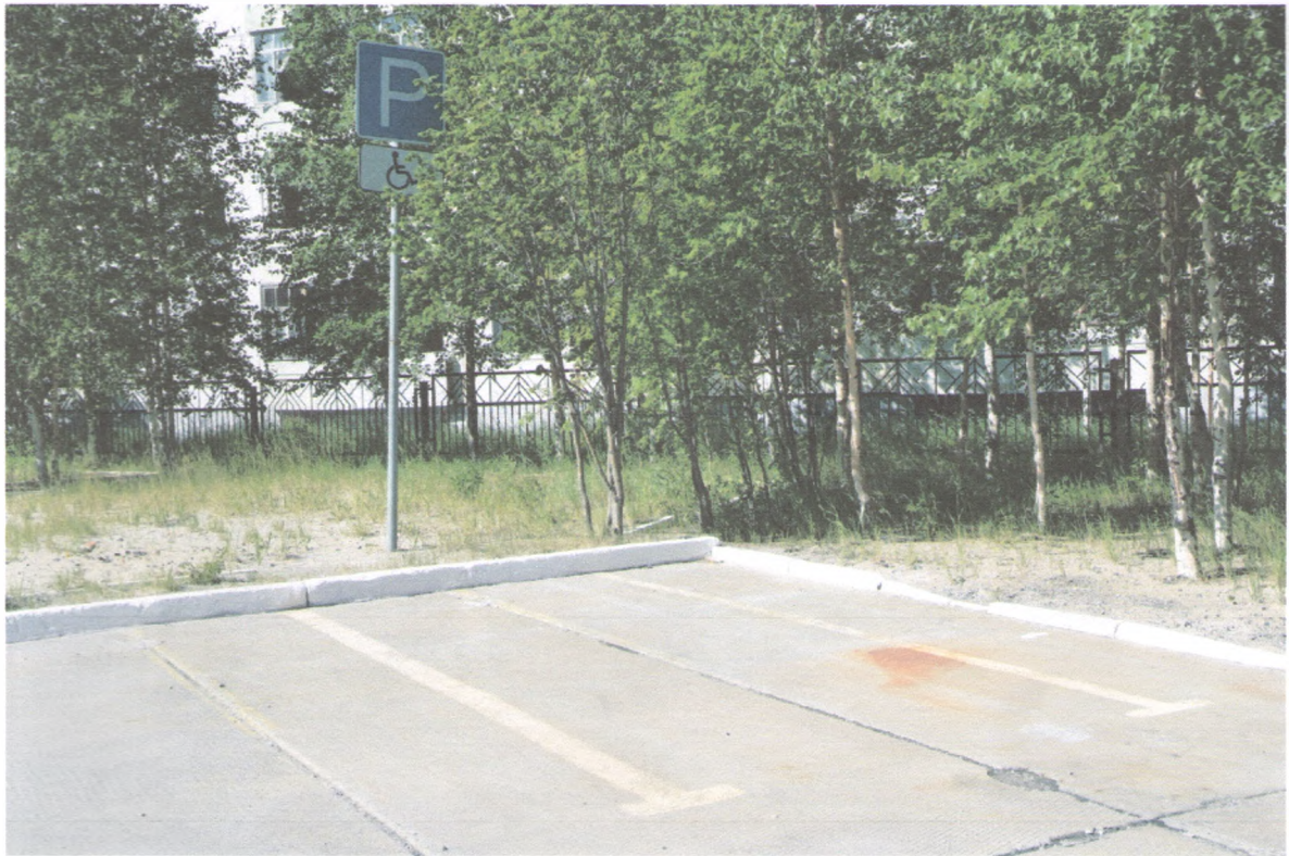
АВТОСТОЯНКА И ПАРКОВКА 1/5