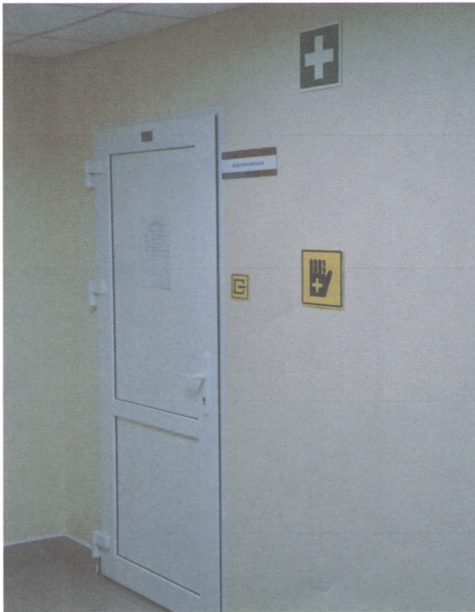
ВХОД В МЕДИЦИНСКИЙ КАБИНЕТ 6/1