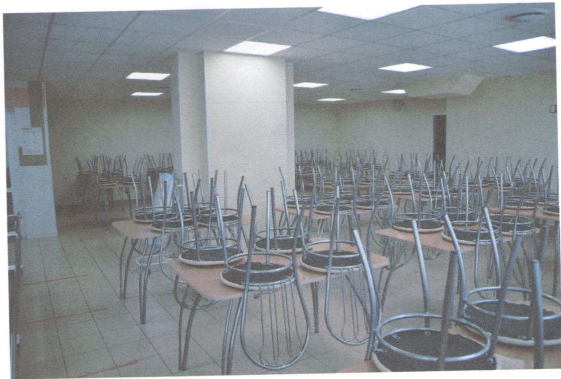
ОБЕДЕННЫЙ ЗАЛ 4/3