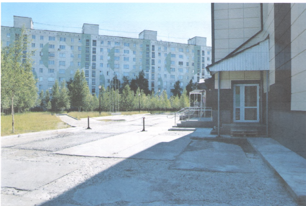
ПУТИ ДВИЖЕНИЯ НА ТЕРРИТОРИИ 1/4