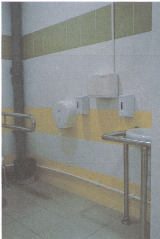
КАБИНКА ТУАЛЕТА 5/4