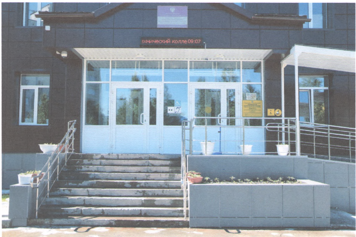
ЛЕТНИЦА НАРУЖНАЯ 1/6