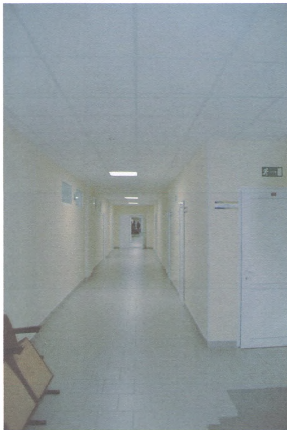
КОРИДОР НА 2 ЭТАЖЕ 3/2