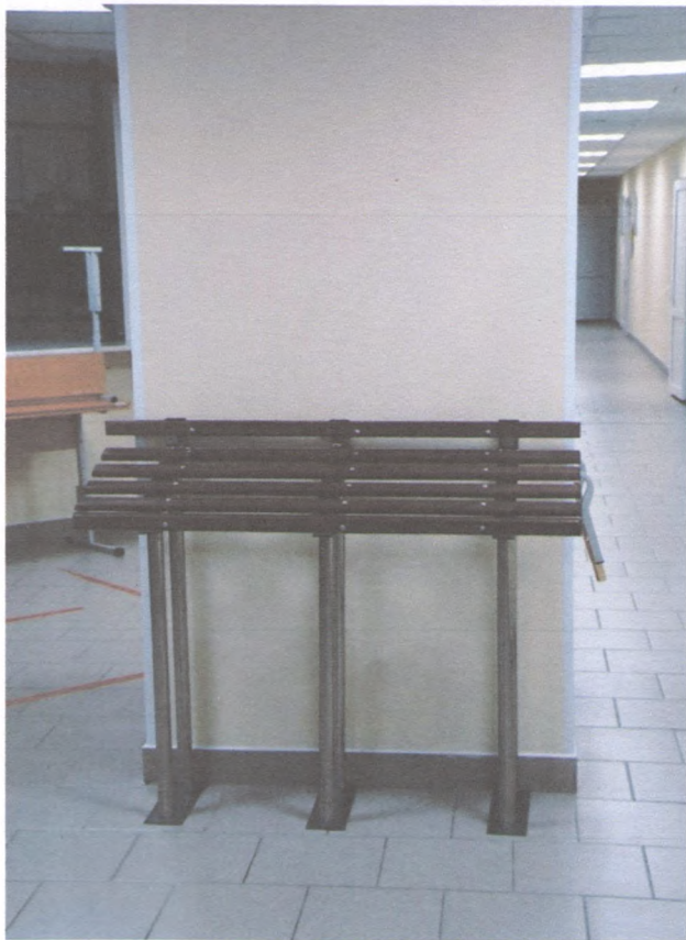
ЗОНА ОЖИДАНИЯ 2/4