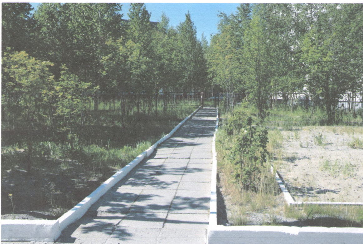
ПУТИ ДВИЖЕНИЯ НА ТЕРРИТОРИИ 1/3