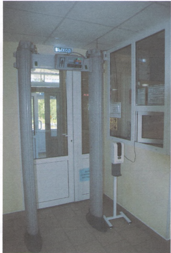
ВХОДНАЯ ЗОНА 2/1