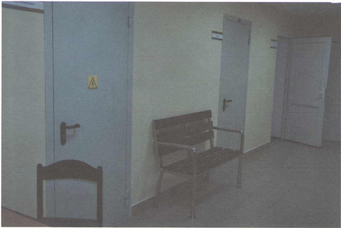
ЗОНА ОЖИДАНИЯ 2/3