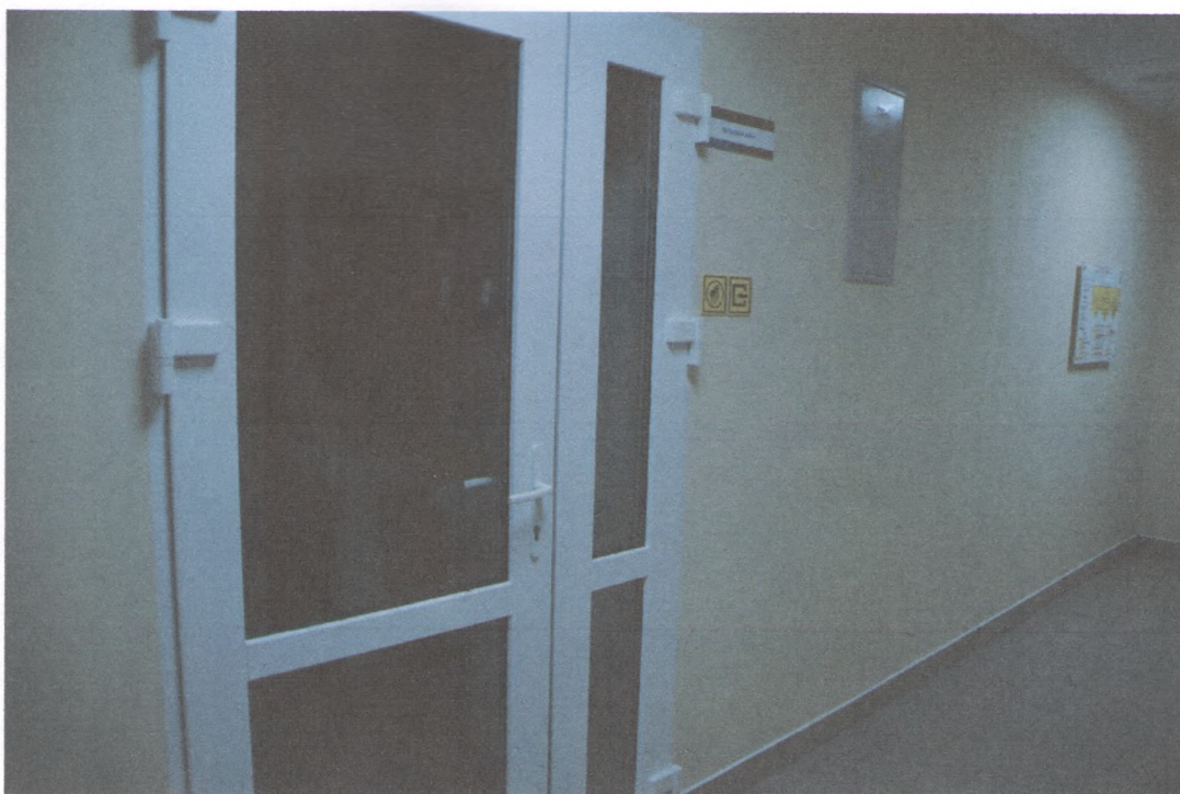
ВХОД В СТОЛОВУЮ 4/1