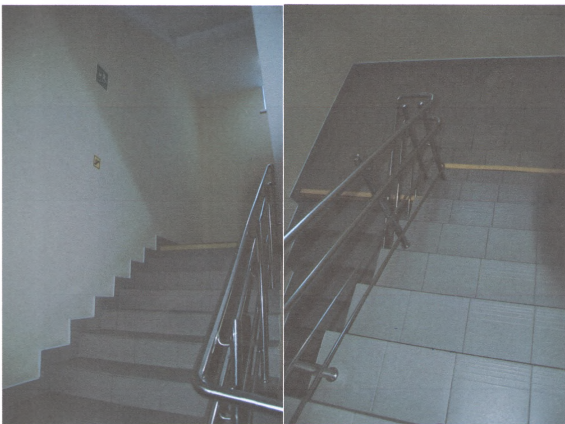
ЛЕСТНИЦА ВНУТРИ ЗДАНИЯ 2/6