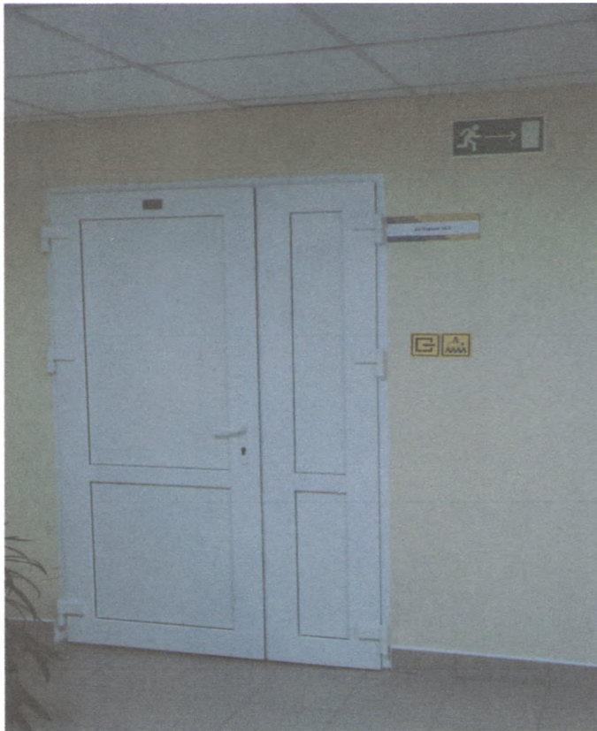
ВХОД В АКТОВЫЙ ЗАЛ 4/6