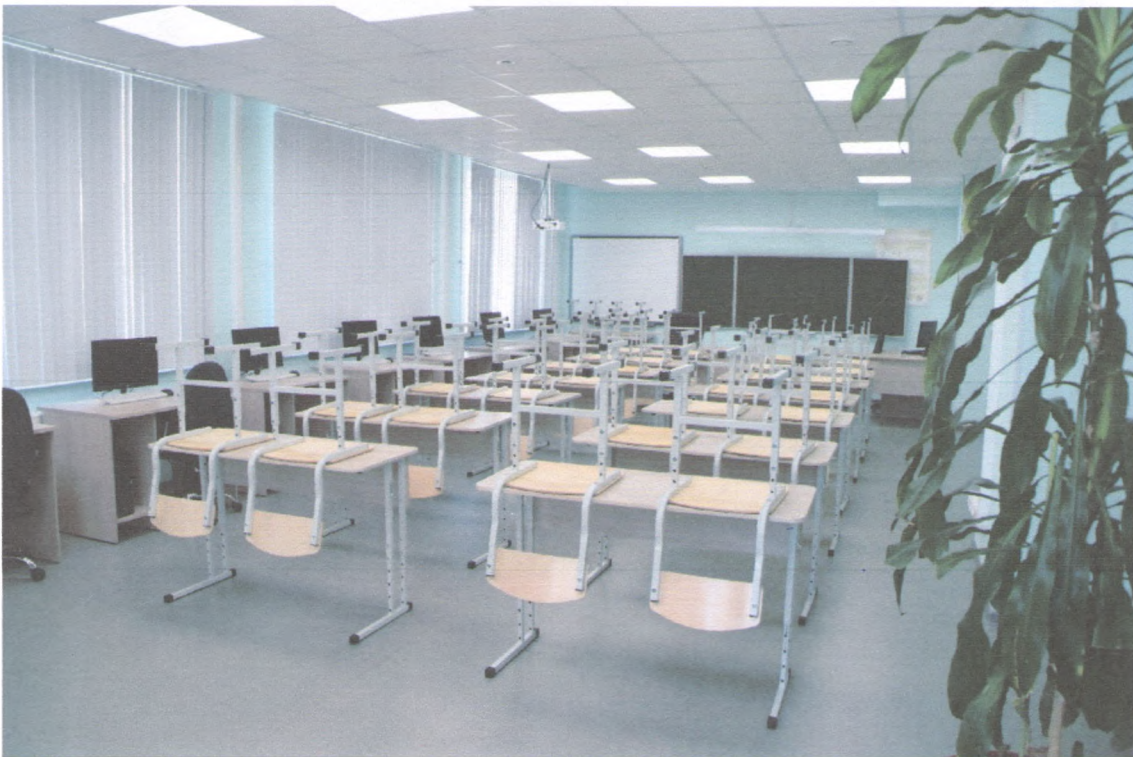
УЧЕБНЫЙ КАБИНЕТ 3/4