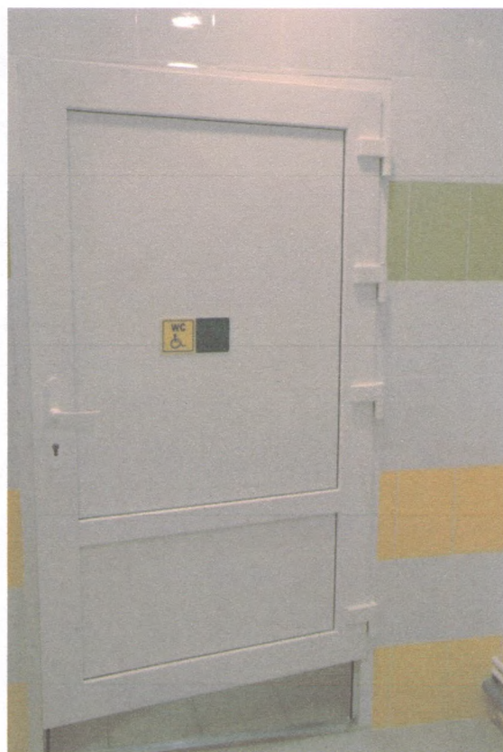
ДВЕРЬ КАБИНКИ ТУАЛЕТА 5/2