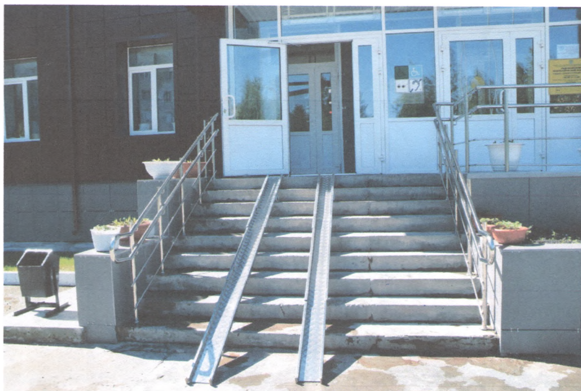
ЛЕТНИЦА НАРУЖНАЯ 1/8