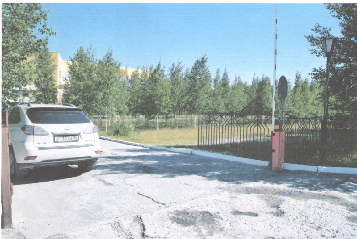
ВХОД НА ТЕРРИТОРИЮ 1/1