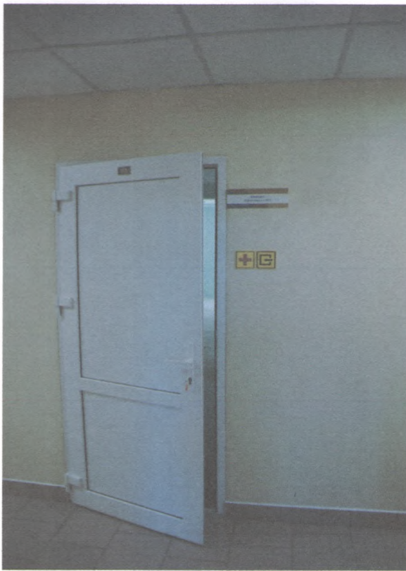
ВХОД В КАБИНЕТ 3/3