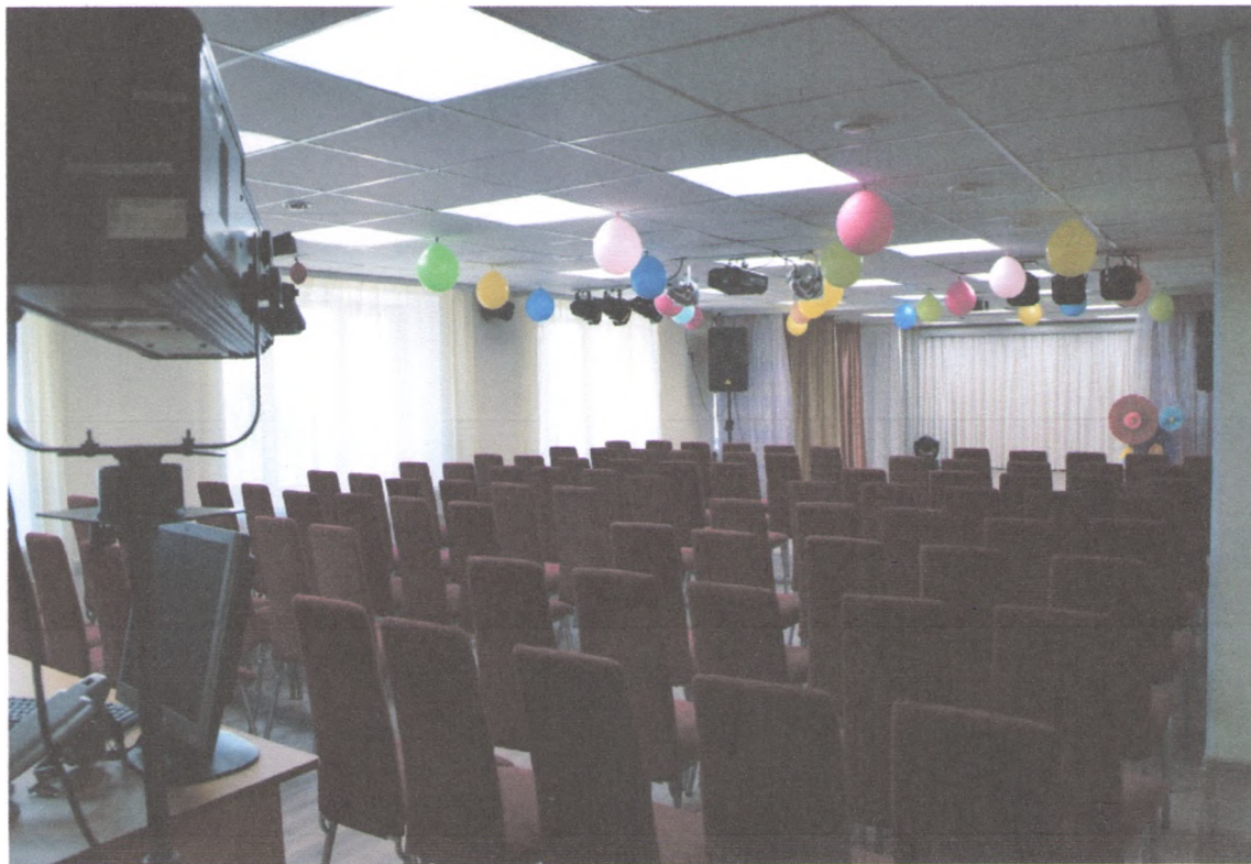
АКТОВЫЙ ЗАЛ 4/7