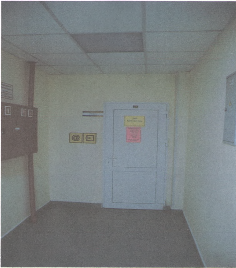
ВХОД В БИБЛИОТЕКУ 4/4