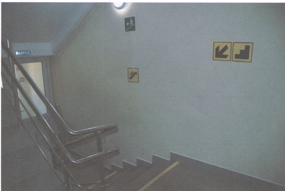
ПУТИ ЭВАКУАЦИИ 2/5