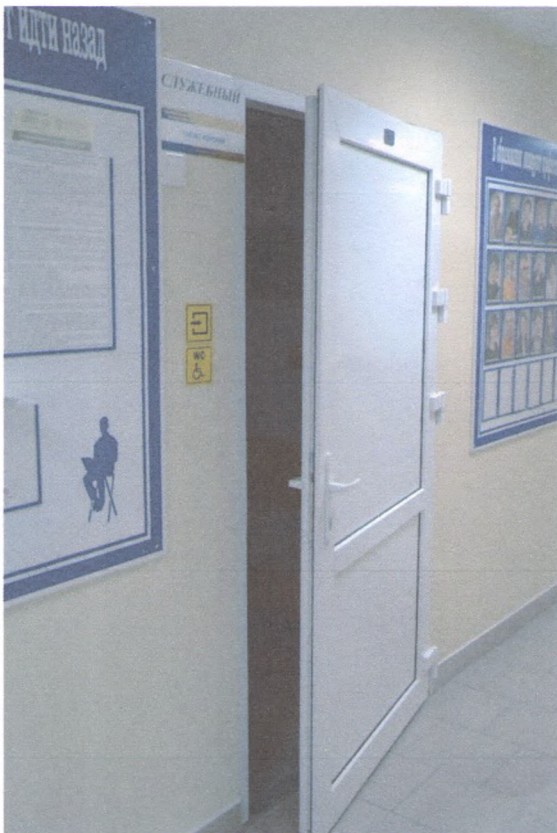
ВХОД В ТУАЛЕТ 5/1