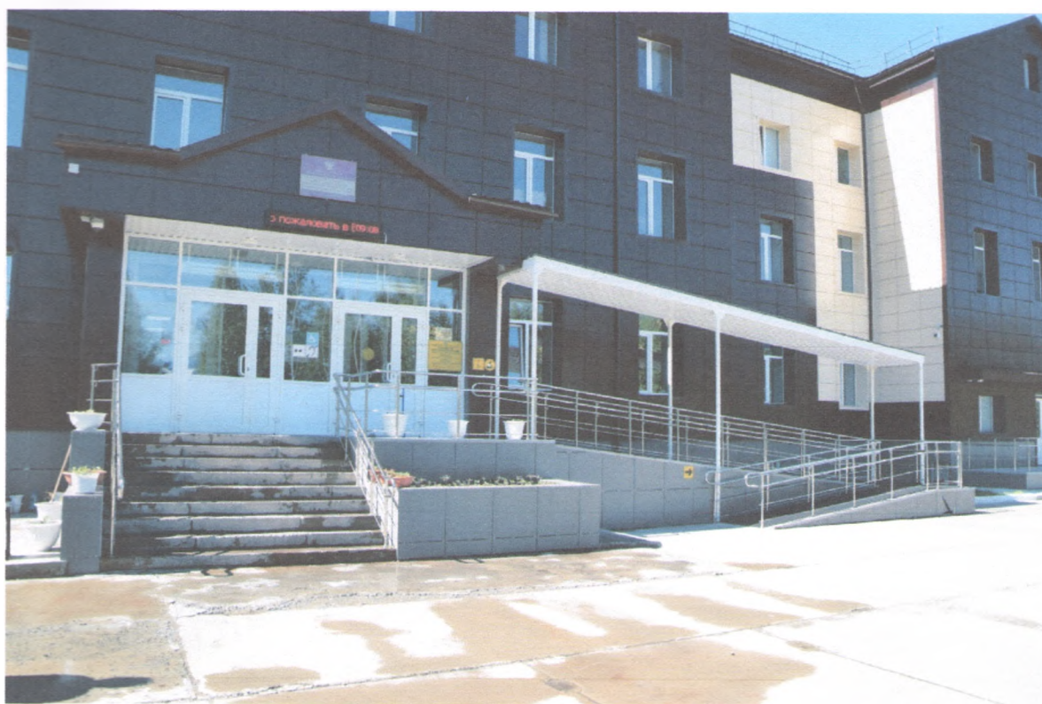
ЛЕСТНИЦА НАРУЖНАЯ 1/7