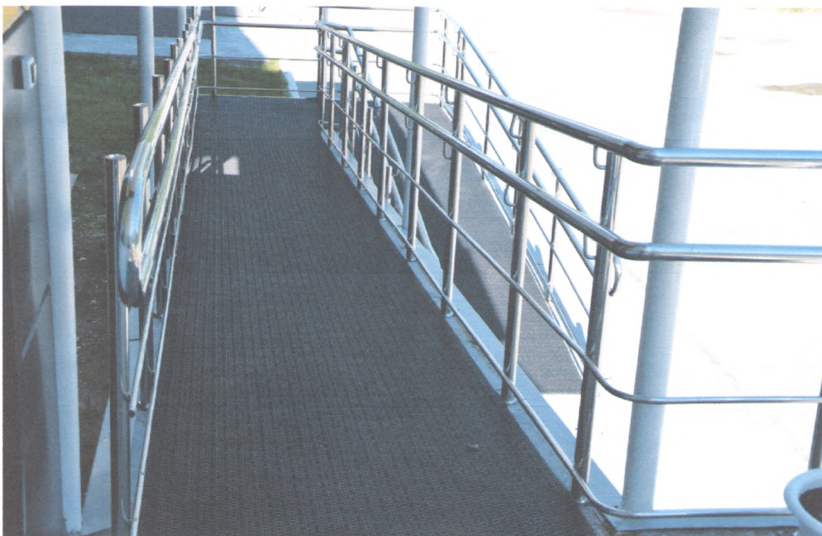
ПАНДУС НАРУЖНЫЙ 1/10