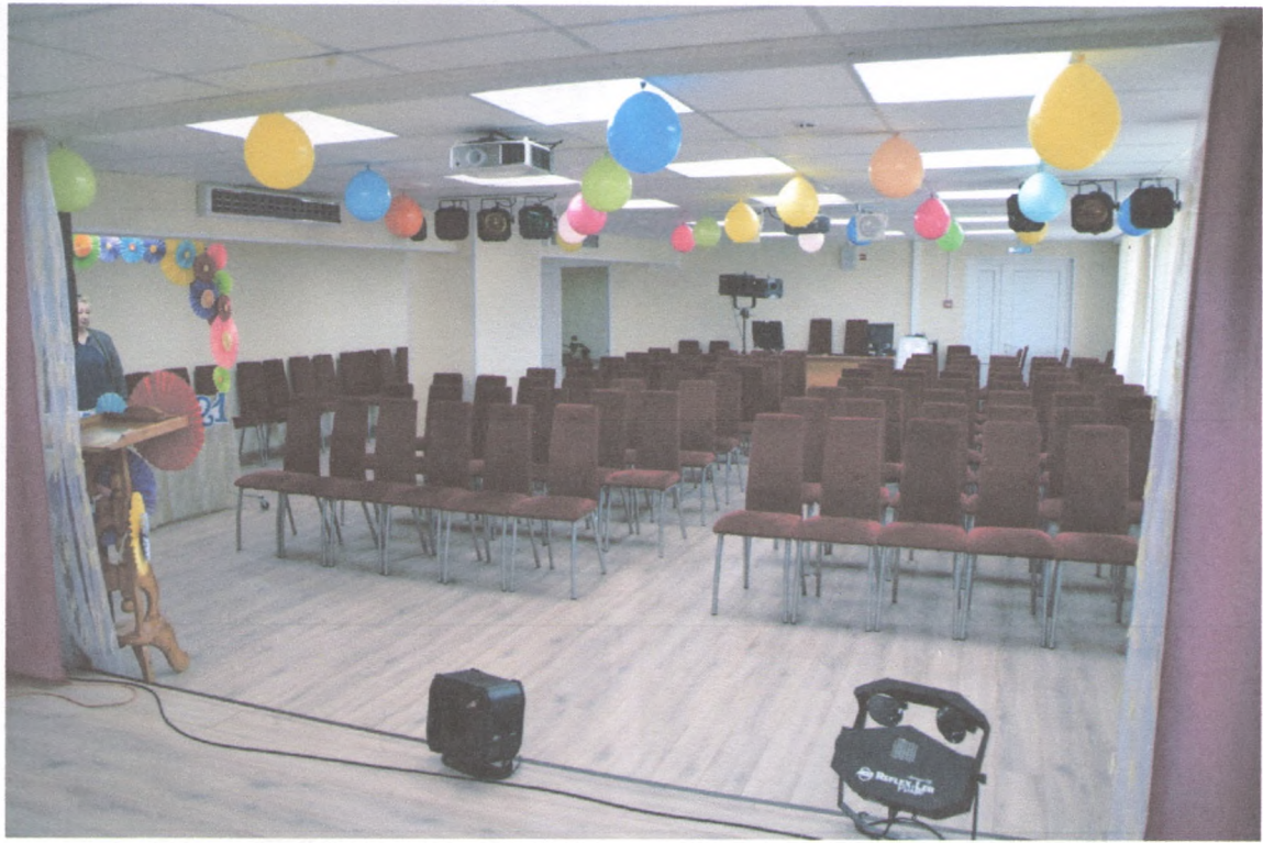
АКТОВЫЙ ЗАЛ 4/8