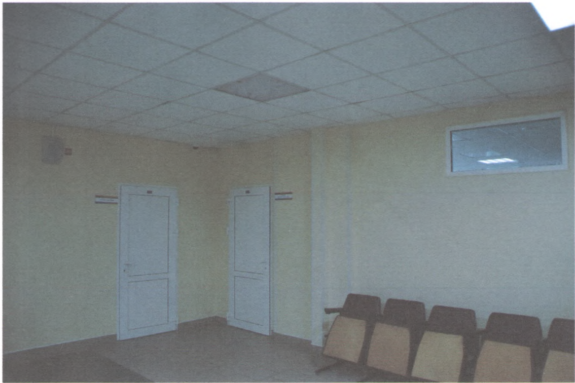
РЕКРЕАЦИЯ НА 2 ЭТАЖЕ 3/1