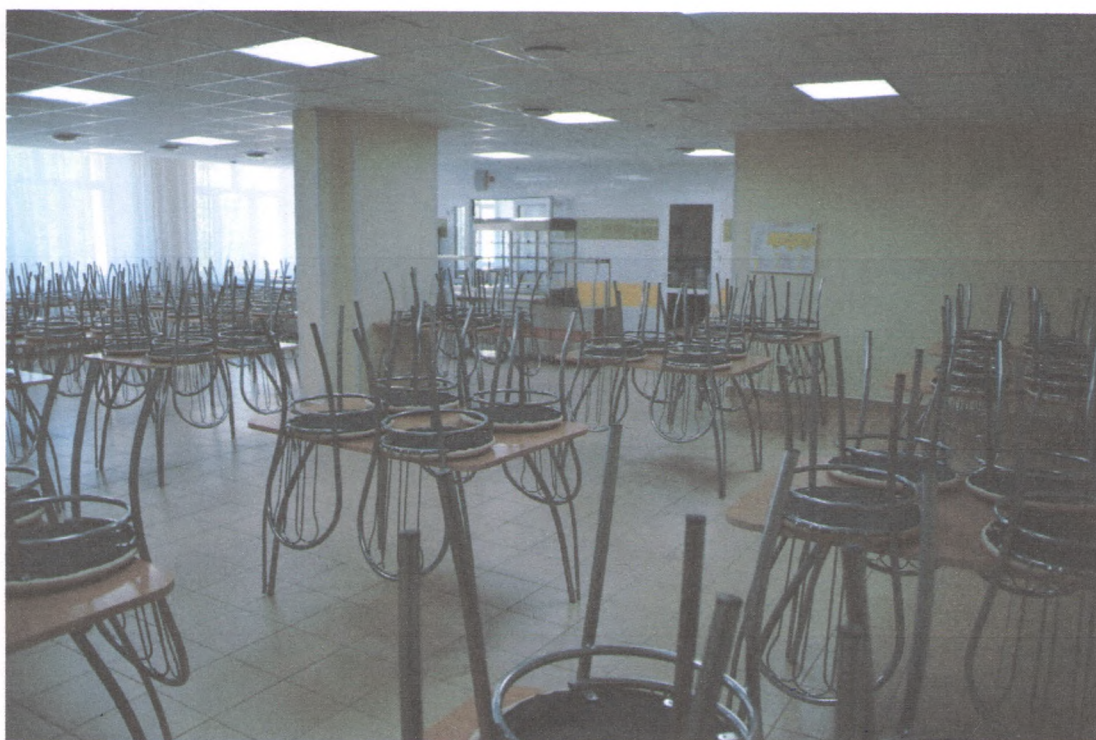
ОБЕДЕННЫЙ ЗАЛ 4/2